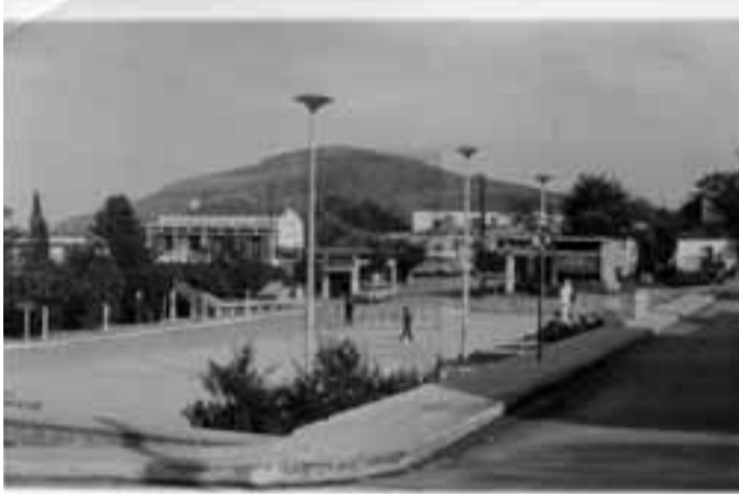
Γράφει ο Δημήτρης Βαρακλιώτης

Η νέα εικόνα της Πλατείας Δημαρχείου στα Φάρσαλα δεν είναι απλώς μια χαμένη ευκαιρία για την αισθητική αναβάθμιση της πόλης. Είναι ένα έργο που προκαλεί το δημόσιο αίσθημα, συνδυάζοντας την αρχιτεκτονική αποξένωση με έναν εξοργιστικό, θεσμικό αποκλεισμό: την πλήρη αδυναμία πρόσβασης των Ατόμων με Αναπηρία ΑμεΑ από κομβικά σημεία της. Εκεί που ο πολίτης περίμενε έναν χώρο σύγχρονο, φιλικό και συμπεριληπτικό, παρέλαβε μια έκταση στρωμένη με πλακάκια που υψώνει «τείχη» απέναντι στους πιο ευάλωτους. Βόρεια και νότια πλευρά. Το άβατο της πλατείας: Το πιο σοβαρό ατόπημα της νέας διαμόρφωσης δεν είναι