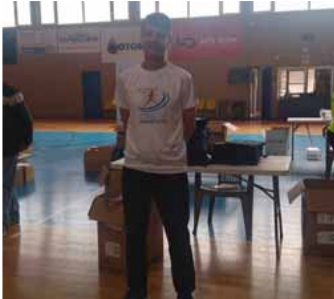
Δυναμική παρουσία σε ολόκληρη την ελληνική επικράτεια κατέγραψαν οι δρομείς των Φαρσάλων τις τελευταίες εβδομάδες, συμμετέχοντας