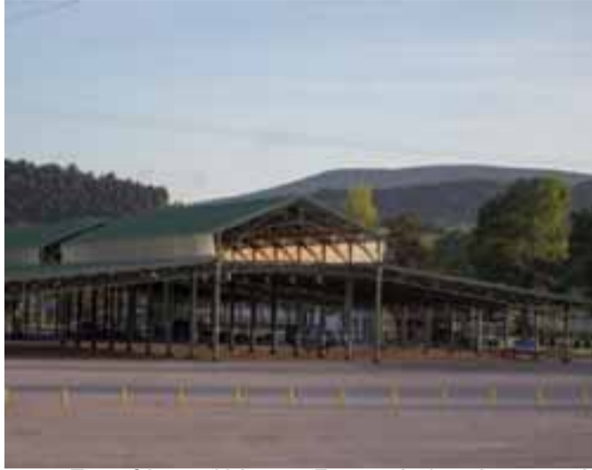
Ποιες θέσεις αλλάζουν και πώς θα λειτουργήσει η αγορά