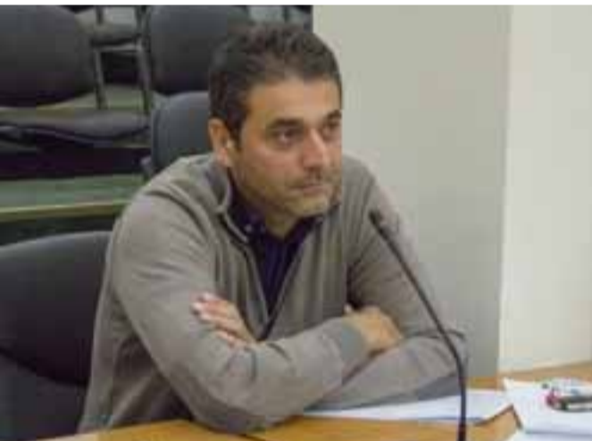
Γράφει ο Γιώργος Αρσενόπουλος...

Από αρχαιοτάτων χρόνων, η αξία του μασκαρέματος δεν περιοριζόταν στην ψυχαγω-