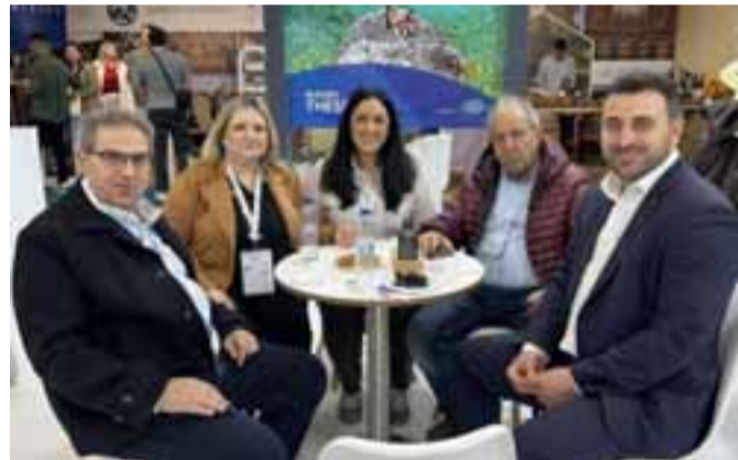
ζητήματα ανάπτυξης του τουριστικού προϊόντος στην περιφέρεια μέσω της ανάδειξης της ιστορικής και πολιτισμικής κληρονομιάς, αλλά και της ανάπτυξης εναλλακτικών μορφών τουρισμού. Σε δήλωσή του ο κ.