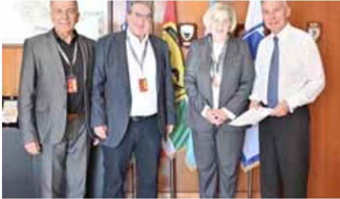
Με τον Υφυπουργό Εθνικής Άμυνας κ. Αθανάσιο Δαβάκη συναντήθηκαν ο Δήμαρχος