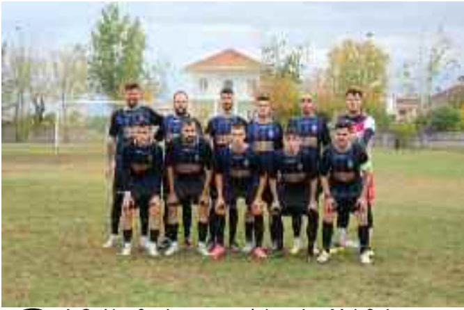
Ο Α.Ο. Ναρθακίου γνώρισε την ήττα με σκορ 3-1 από τον Φιλοκτήτη Μελιβοίας στον πρώτο αγώνα για το νέο έτος.