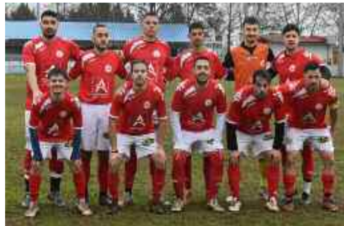
στους 13 βαθμούς και την 11η θέση, ενώ ο Τοξότης έφτασε τους 16 βαθμούς και βρίσκεται στην 10η θέση.

Το παιχνίδι έγινε σε έναν πολύ κακό αγωνιστικό χώρο, ο Τοξότης ήταν εκείνος που από την αρχή επέβαλε τον ρυθμό του και φυσικά πήρε μια πολύ σημαντική νίκη, απέναντι στον Αχιλλέα που παρουσιάστηκε με πολλές απουσίες και τραυματισμούς. Στο 9' ο Βασίλης Νούσιος με ατομική ενέργεια και σουτ έκανε το 1-0. Στο 20' ο Θοδωρής Ασίκογλου ξέφυγε από την άμυνα, έκανε το σουτ που κατέληξε κόρνερ. Στο 22' καλό σουτ από πλάγια θέση του Τσακνάκη Ρ., έδωσε θεαματικά ο Μολόχας σε κόρνερ. Στο 60' ο Σουλιώτης με σουτ έκανε το 2-0, ύστερα από σύγχυση στην περιοχή. Στο 62' ο Αλίκος έκανε το σουτ από μακριά, η μπάλα βρήκε στο οριζόντιο δοκάρι και στην επαναφορά και πάλι ο Νούσιος έκανε το 3-0. Στο 65' ο Θοδωρής