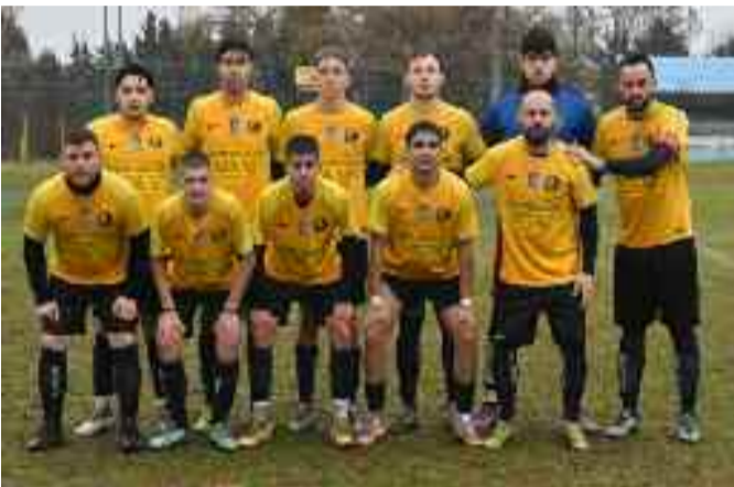
Τ οξότης και Αχιλλέας Φαρσάλων αναμετρήθηκαν στο γήπεδο «Κουκουλίτσιος - Μουσιάρης» και ο γηπεδούχος Τοξότης επικράτησε με σκορ 4-0. Έτσι ο Αχιλλέας παρέμεινε